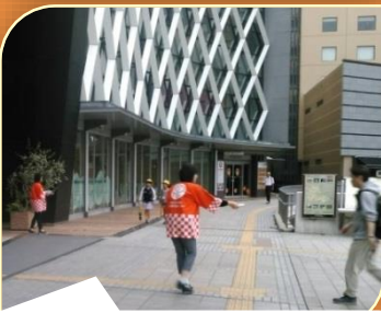
通勤中・通学中のかたへPRティッシュ を配るスタッフ JR水戸駅南口