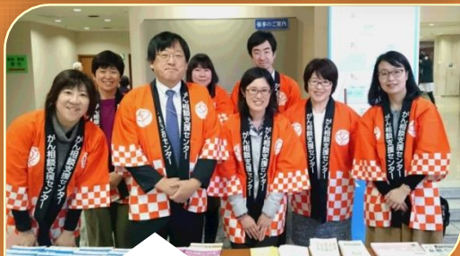
大谷がんセンター長とゆかいな仲間達♡

北は日立市から、南はつくば市 まで、計8回行われました。 本年度はあと2回の活動が予定 されています。