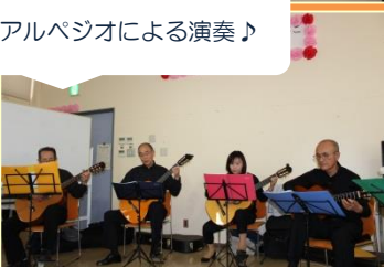
アルペジオによる演奏♪