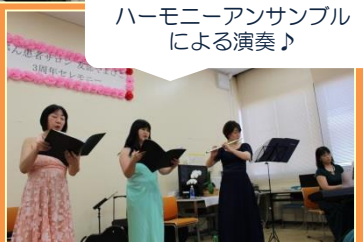
ハーモニーアンサンブル による演奏♪

通常は、毎月第1月曜日13時～開催しています。※予約不要 情報交換・勉強会・リハビリ体操などを行っています。 ～ほっとする場を提供できるよう支援しています～