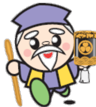
茨城県マスコット ハッスル黄門