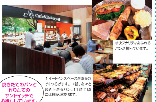
オリジナルあふれるパンが揃っています。

↑イトインスペースがあるのでくつろげます。→朝、次々と焼き上がるパン。11時半頃には櫃が埋まります。