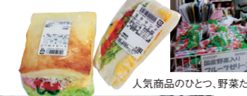
人気商品のひとつ、野菜たっぷりのサンドイッチ。

営業時間 ・平日 8:30~18:00 ・土曜 9:00~15:00 ・日曜・祝祭日 休み