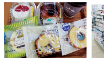
ローソンオリジナルスイーツが人気です。患者さまのニーズを取り入れたコーナー。