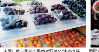
店頭並ぶ季節の果物や野菜なども売れ筋。