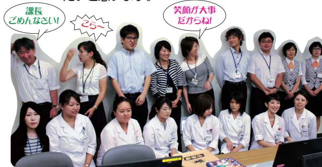
患者さまに接する職員の他にもたくさんの医事課職員がいます。

簡単に医事課の業務をご紹介しましたが、医事課職員は病院の理念でもある「患者さんに優しい、質の高い、県民に信頼される医療を提供します」を目指し、これからも職員の教育研修をおこない、いつも笑顔で窓口でお迎えできるような心がけたいと思います。