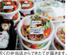
病院近くの弁当店からできたてが届きます。